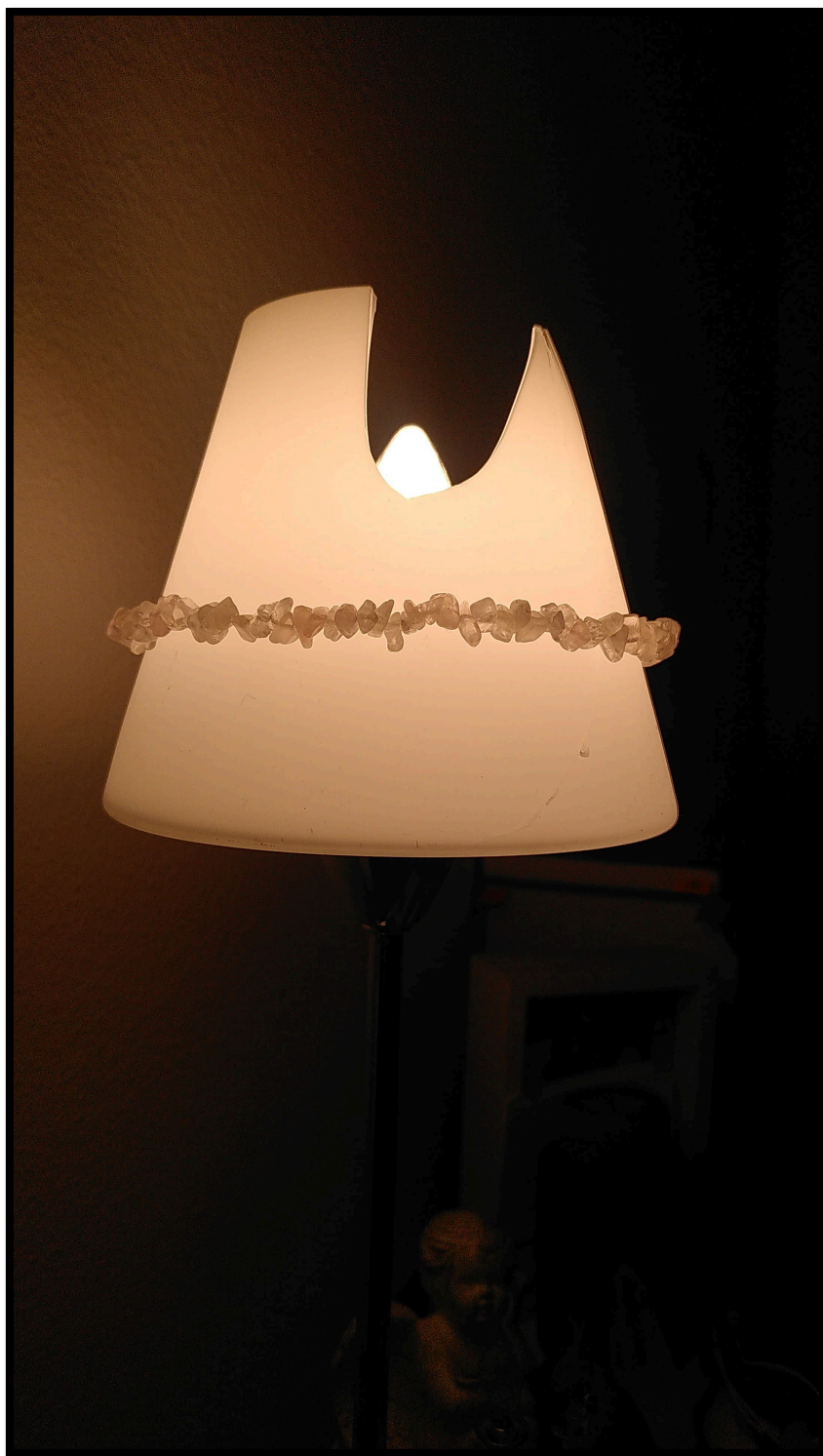
Collier sur la lampe avant le phénomène PSI.