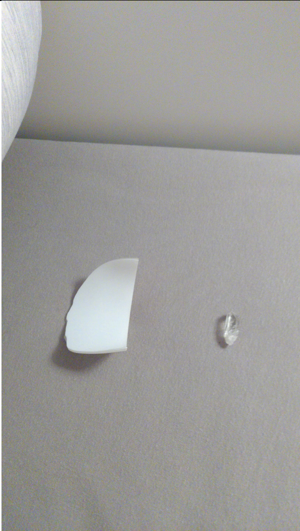
Bout de verre sous l'oreiller.