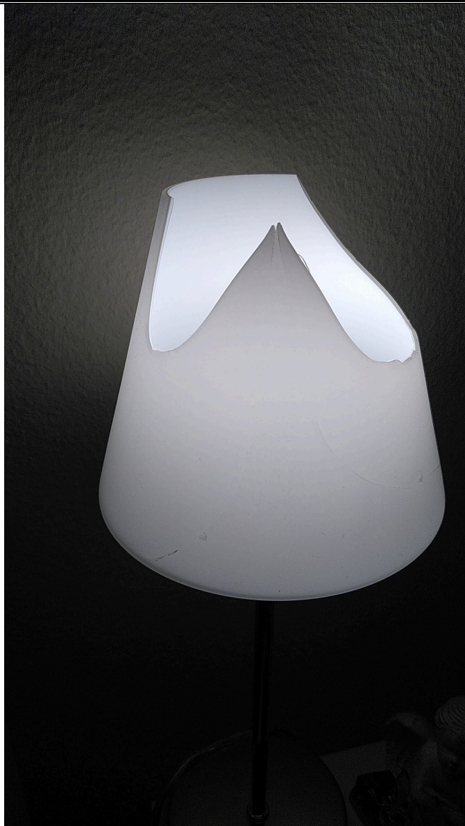
Lampe après le phénomène PSI, brisée en deux endroits.