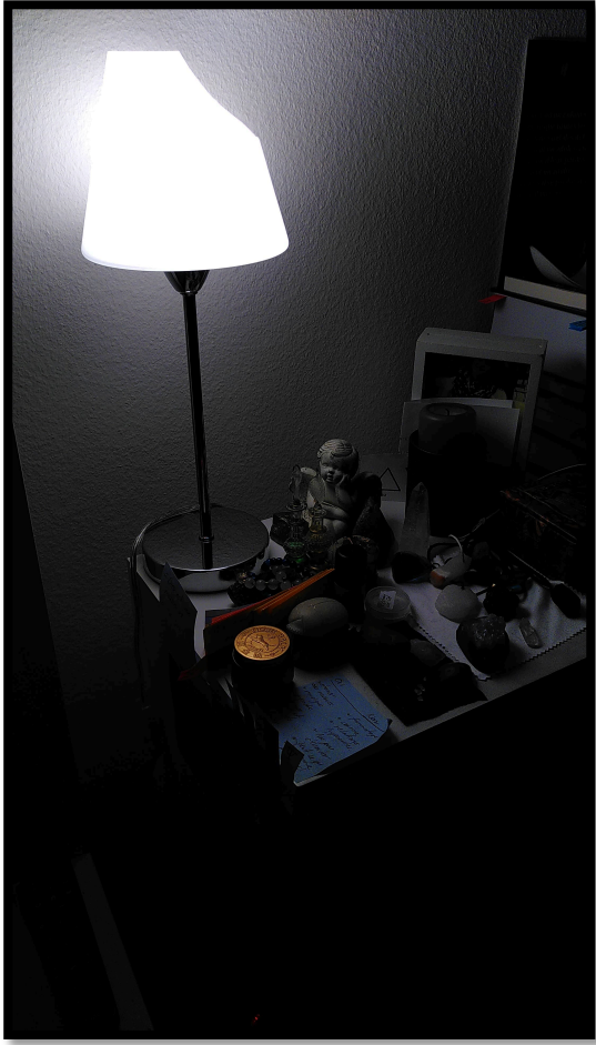
Lampe de chevet : position initiale à 22h (éteinte lors de l'endormissement).